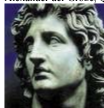
Alexander der Große, Quelle www.romahistory.com :

Mit Alexander dem Großen (gebürtig in Makedonien) haben die Griechen den östlichen Mittelmeerraum bis nach Nordindien unter hellenische Herrschaft gebracht.