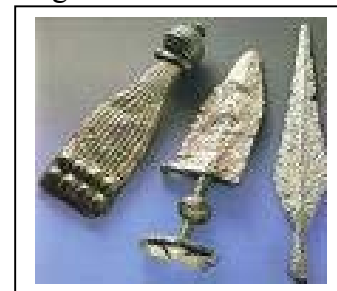
Bewaffnung der frühen Eisenzeit

Bronze wurde durch Eisen ersetzt, da Bronze nicht stabil genug für Kriegswaffen war. Eisen wird genau wie Kupfer aus Erz gefiltert, jedoch reicht die Temperatur von normalem Feuer (ca. 800 Grad Celsius) nicht aus. Da Holzkohlefeuer wesentlich heißer werden als Holzfeuer, wurde das Erz über Holzkohle erhitzt. Holzkohle wird von Köhlern produziert. Das Roheisen wurde in Stahl umgewandelt indem man das Eisen schmiedete. Roheisen ist hart, bricht aber leicht. In dieser Zeit gab es viele Schmiede, an vielen