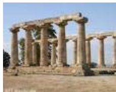
Diese Säulen stammen aus der Zeit 800 v.Chr

Etwa ab 800 v. Chr. wurden zahlreiche griechische Kolonien im gesamten Mittelmeerraum, einschließlich des Schwarzen Meeres gegründet. Meist waren diese Kolonien der Mutterstadt (Metropolis) freundschaftlich verbundene, doch politisch selbständige Stadtstaaten. Griechische Gründungen sind z. B. Nikaia-Nizza, Neapolis-Neapel, Byzantion-ab ca.337 -Konstantinopel, seit 1930 Istanbul.