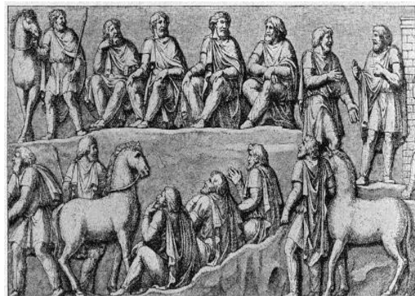
Beratende Adlige und Rat suchende Bauern

Sippen-„Führer“ wurden in ihren Stämmen zu Adligen, wenn sie sich durch Kraft, Mut, Führerschaft, Land und Anhang, meist über mehrere Generationen, auszeichneten. Durch Hilfestellungen und Schutz für andere Familien, erlangten sie deren Gunst und steigerten somit ihren Einfluss. Soweit, dass später meist in Allem bei ihnen Rat eingeholt oder ihre Zustimmung erbeten wurde. Damit erlangten sie Macht. Die Adligen besaßen für gewöhnlich viel Land und darauf abhängige Bauern. Sie konnten sich dadurch mehr der Politik und dem Kriege widmen, später auch der Kultur.