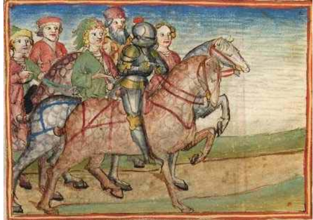
Ein Herr begleitet von seinen Vasallen

Das waren Adlige, die von anderen Adligen abhängig waren. D.h. ein Herr stellte sich freiwillig in den Dienst eines anderen Herren mit der Verpflichtung bestimmter militärischer oder diplomatischen Dienstleistungen, wie z. Bsp. Soldaten für die Kriegsunterstützung. Im Gegenzug erhielt der Vasall von dem Lehnsherrn Schutz und Hilfe in der Not. Beispiel: Könige waren Vasallen des Kaisers. Herzöge und Grafen waren Vasallen der Könige. Usw.