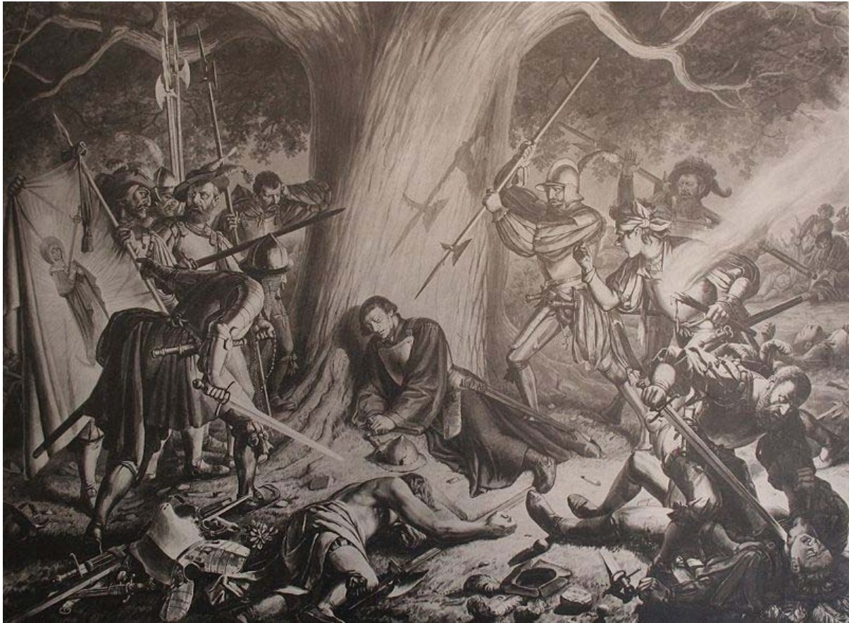
Die Ermordung von Huldrych Zwingli im 2. Kappeler Krieg ( zeitgenöss. Gemälde von 1531)