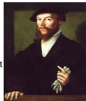
Johannes Calvin (1509-1564)